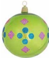
AD 55 apfelgrün glanz/ apple green brilliant