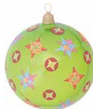
AD 12 apfelgrün glanz/ apple green brilliant