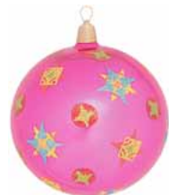
AD 13 pink glanz/ pink brilliant