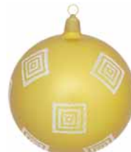
AD 77 gold metallic/ gold metallic