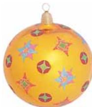
AD 10 goldorange glanz/ gold orange brilliant