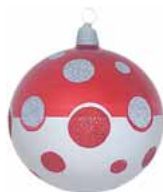
AD 86 rot-silber metallic/ red-silver metallic