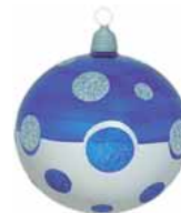
AD 88 blau-silber metallic/ blue-silver metallic