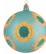
AD 110 metallic hellblau mit orange- farbigem Glitter/ metallic light blue and orange glittering