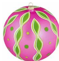
AD 125 pink seidenmatt/ pink frosted