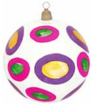
AD 90 opalweiß glanz/ opal white brilliant