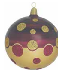
AD 85 aubergine-gold metallic/ aubergine-gold metallic