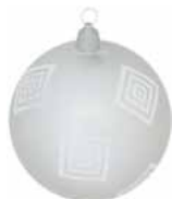
AD 70 silber metallic/ silver metallic