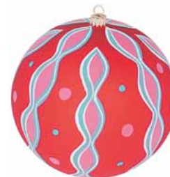
AD 157 rot seidenmatt/ red frosted