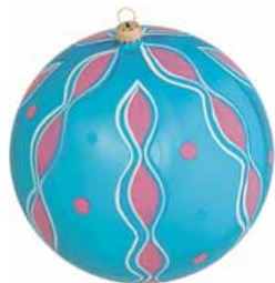
AD 122 blau glanz/ blue brilliant