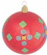
AD 51 rot glanz/ red brilliant