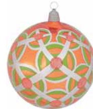
AD 44 orange glanz/ orange brilliant