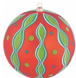
AD 123 rot seidenmatt/ red frosted