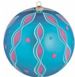
AD 126 blau seidenmatt/ blue frosted