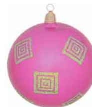
AD 80 pink metallic/ pink metallic