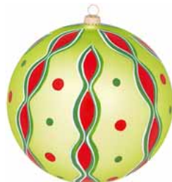
AD 124 goldgrün seidenmatt/ gold green frosted