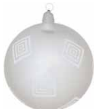
AD 76 silber metallic/ silver metallic