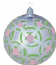
AD 42 stahl glanz/ steel brilliant