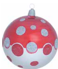
AD 82 rot-silber metallic/ red-silver metallic