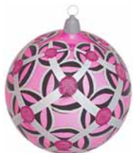
AD 39 pink glanz/ pink brilliant