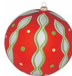
AD 155 rot seidenmatt/ red frosted