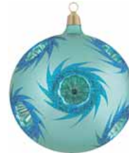
AD 111 metallic hellblau mit blauem Glitter/ metallic light blue and blue glittering