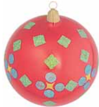
AD 45 rot glanz/ red brilliant