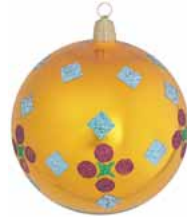
AD 47 goldorange glanz/ gold orange brilliant