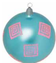
AD 79 blau metallic/ blue metallic