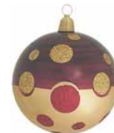
AD 89 aubergine-gold metallic/ aubergine-gold metallic