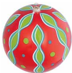
AD 119 rot glanz/ red brilliant