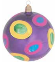
AD 92 blauviolett glanz/ blue violet brilliant