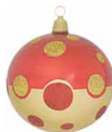
AD 87 rot-gold metallic/ red-gold metallic