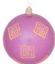
AD 81 violett metallic/ violet metallic