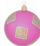
AD 74 pink metallic/ pink metallic