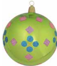
AD 49 apfelgrün glanz/ apple green brilliant