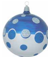
AD 84 blau-silber metallic/ blue-silver metallic