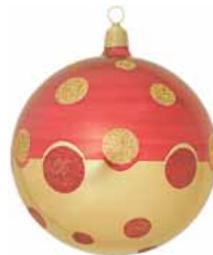
AD 83 rot-gold metallic/ red-gold metallic