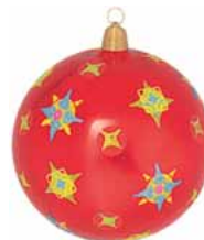
AD 08 rot glanz/ red brilliant