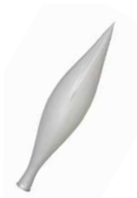
AD 02 silber metallic/ silver metallic