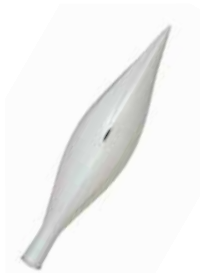
AD 04 silber glanz/ silver brilliant