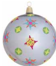
AD 09 stahl glanz/ steel brilliant