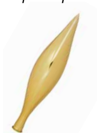
AD 03 gold glanz/ gold brilliant