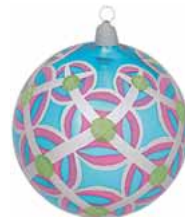
AD 43 karibikblau glanz/ caribic blue brilliant