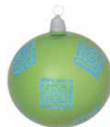
AD 72 grün metallic/ green metallic