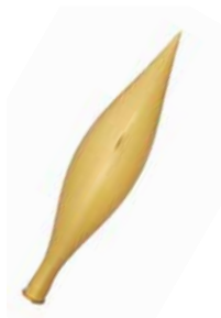
AD 01 gold metallic/ gold metallic