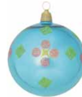
AD 54 karibik blau glanz/ caribic blue brilliant