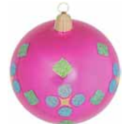
AD 56 pink glanz/ pink brilliant