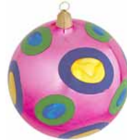
AD 93 pink glanz/ pink brilliant