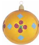
AD 53 goldorange glanz/ gold orange brilliant