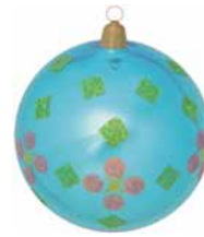
AD 48 karibik blau glanz/ caribic blue brilliant