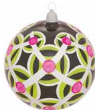
AD 41 opalschwarz glanz/ opal black brilliant