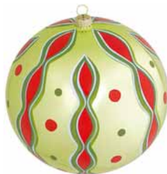
AD 120 goldgrün glanz/ gold green brilliant