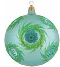
AD 108 metallic hellblau mit grünem Glitter/ metallic light blue and green glittering