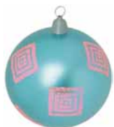
AD 73 blau metallic/ blue metallic