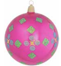
AD 50 pink glanz/ pink brilliant