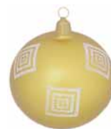
AD 71 gold metallic/ gold metallic