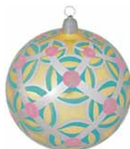
AD 40 limone glanz/ lime brilliant