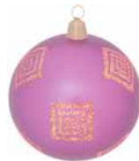
AD 75 violett metallic/ violet metallic