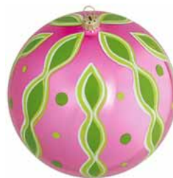
AD 121 pink glanz/ pink brilliant