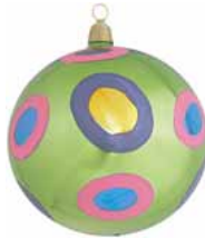
AD 91 grün glanz/ green brilliant