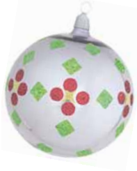
AD 46 stahl glanz/ steel brilliant