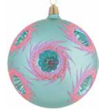
AD 109 metallic hellblau mit pinkfarbigem Glitter/ metallic light blue and pink glittering