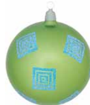
AD 78 grün metallic/ green metallic