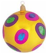
AD 94 goldgelb glanz/ yellow gold brilliant