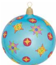
AD 11 karibikblau glanz/ caribic blue brilliant