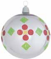
AD 52 stahl glanz/ steel brilliant