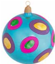
AD 95 blau glanz/ blue brilliant